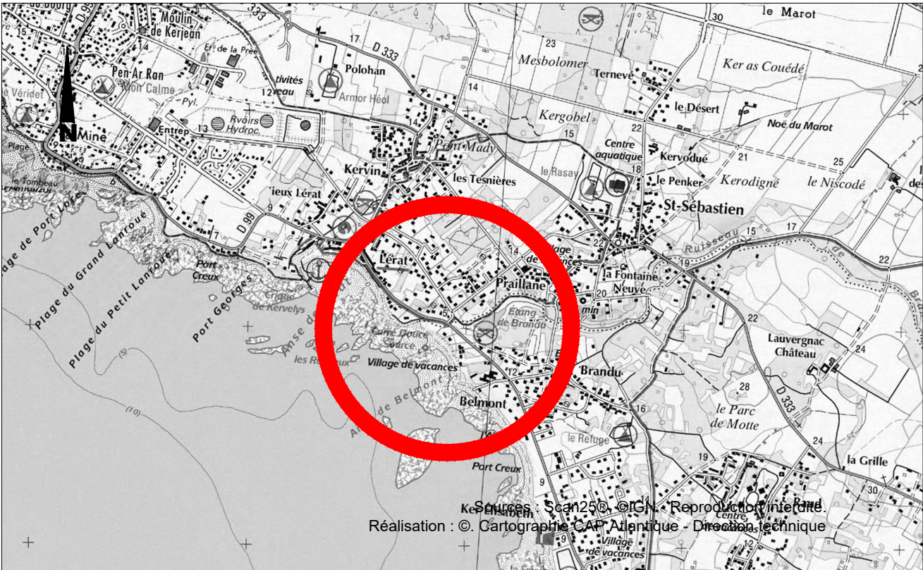
PLAN DE SITUATION - ECH 1/25000